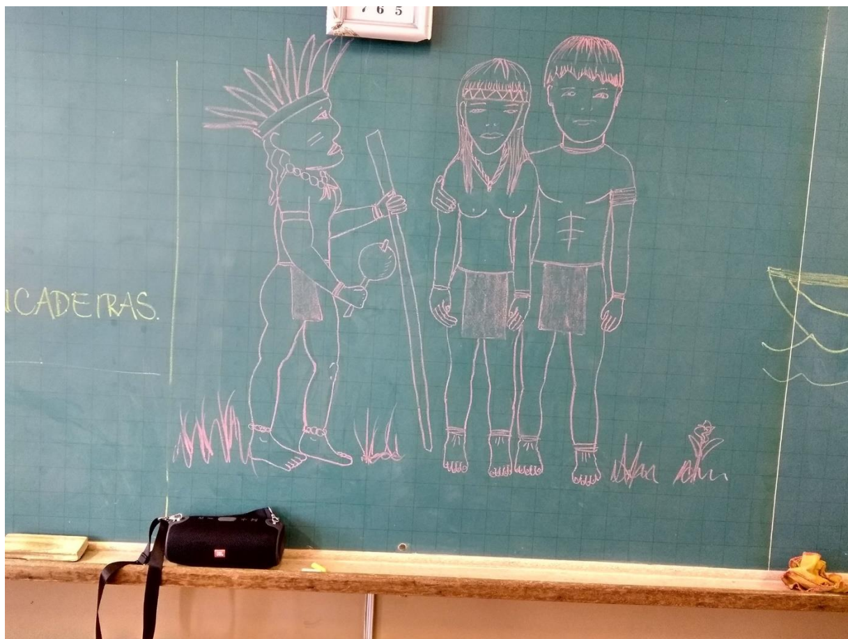
Desenho efetuado por Muniz na lousa de sala de aula do primeiro ano do Ensino Fundamental da rede municipal de ensino de Sao Carlos.